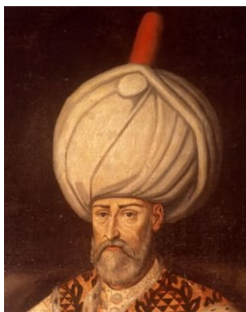
Soliman le Magnifique

Ce traité offrit à la France le privilège de commercer avec tous les ports de l'Empire Ottoman ce qui va assurer la prospérité du port de Marseille. Il confie aussi au roi de France la protection des lieux saints et des chrétiens de l'Empire. Les Capitulations seront renouvelées en 1604 et resteront en vigueur jusqu'à la 1 ère guerre mondiale.