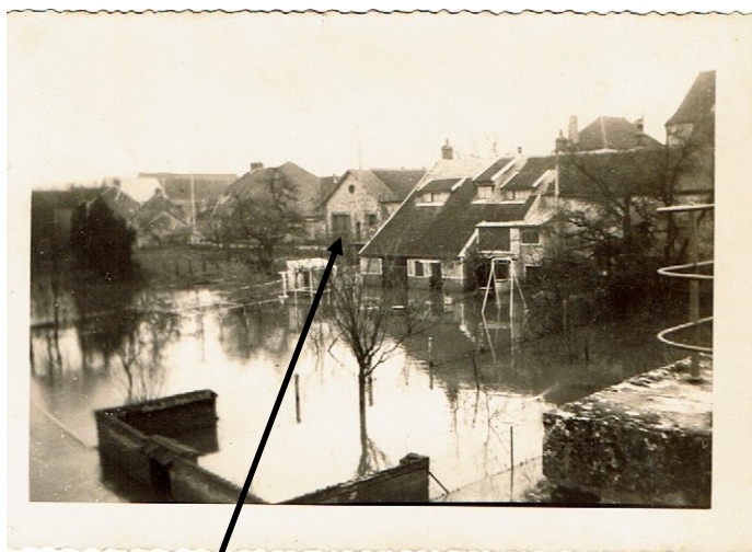
« La prison »

Sur le milieu de la photo ci-dessous nous voyons le bâtiment en question. Cette photo a été prise en 1955 au moment des inondations et l'on comprend bien l'ancien nom de cette rue : la Rue Basse. On y voit aussi à droite le chevet de l'église et le toit du presbytère devenu la mairie.